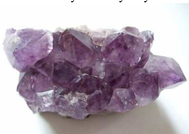
Obr. 1. Ametystové krystaly